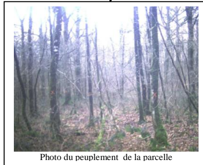
Photo du peuplement de la parcelle